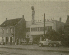
Een zicht van de voorgevel der « AMERICAN GARAGE ».

Niet alleen in kunst, in sport, maar ook in handel en nijverheid, streemt men nu en dan, dat erge in het land - EEN VLAANDERNAAR - op schitterende wijze uitblinkt!!!