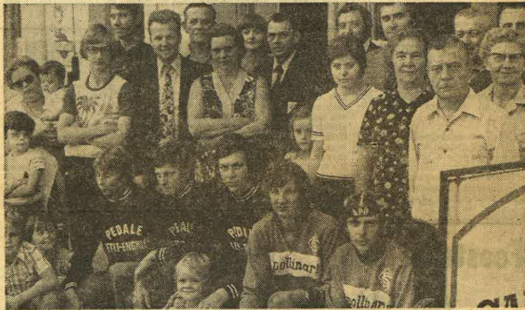
De vijf jonge renners omringd door de bestuursleden van de nieuwe club en deze van Sporta Halle.