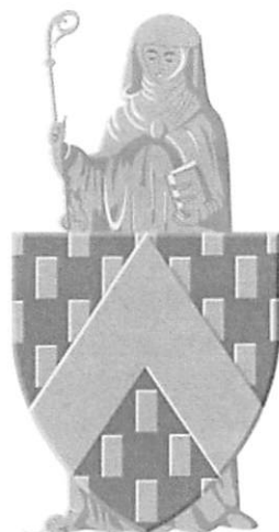
Wapen van Ternat

Kampenhout als in Boortmeerbeek de baanwinkels en bedrijven werden neergepoot zonder aangepaste wegeaanleg is duidelijk geen na te volgen voorbeeld. De manier waarop die industriezone zonder veel respect voor de naastgelegen bewoning werd aangelegd en ontwikkeld is dat evenmin.