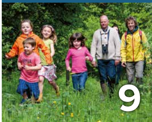
Wandelnetwerk Demer en Dijle